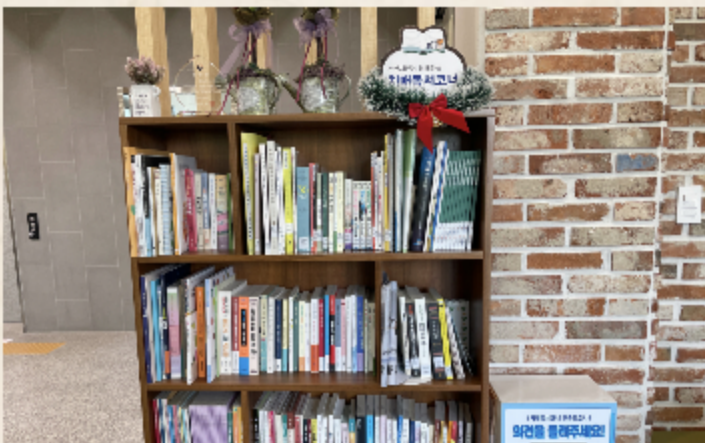
논산시 치매안심센터 치매독서코너